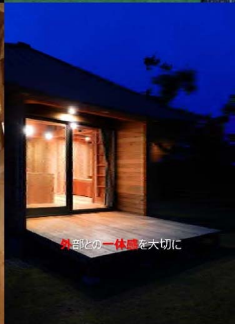
外部との一体感を大切に