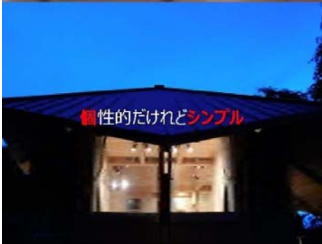
個性的だけれどシンプル