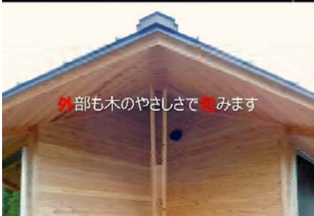
外部も木のやさしさで包みます