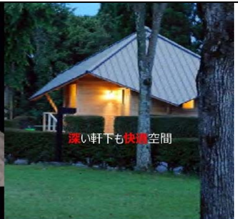
深い軒下も快適空間