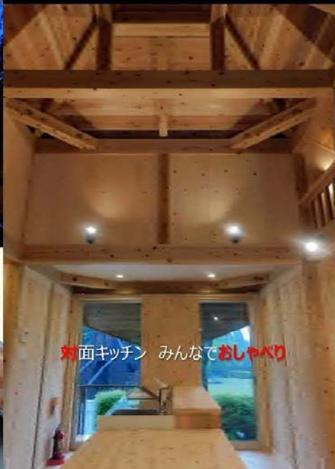
対面キッチン みんなでおしゃべり