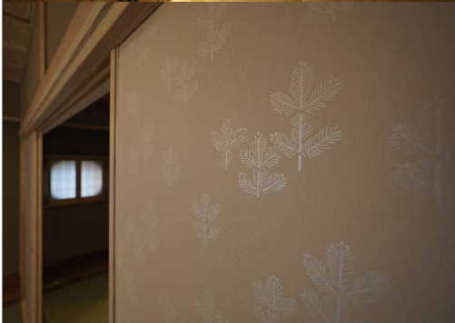
左上：土間席の個室から前庭を見る